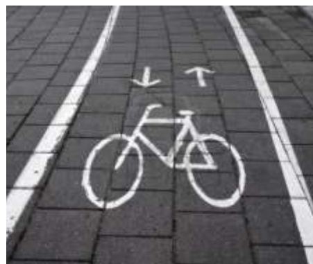
burkolat=23 Beton járólap