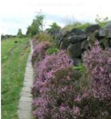
burkolat=23 Beton járólap