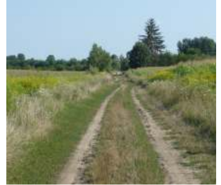
burkolat=041 Földes-kavicsos középen füves