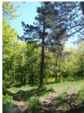
burkolat=041 Földes-kavicsos középen füves