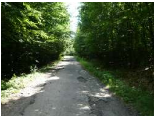
burkolat=0321 Rossz aszfalt