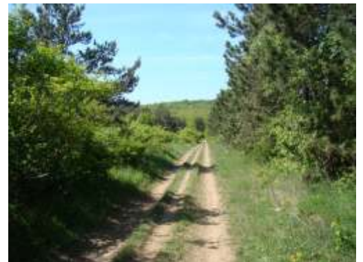
burkolat=041 Földes-kavicsos középen füves