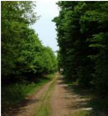
burkolat=041 Földes-kavicsos középen füves