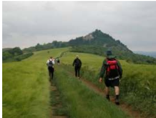
burkolat=041 Földes-kavicsos középen füves