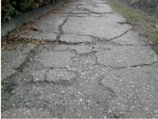
burkolat=311 Rossz beton

Egy településen belüli burkolt járda, vagy park burkolt gyalogútja, amely elzárt a gépjármű forgalom elől.